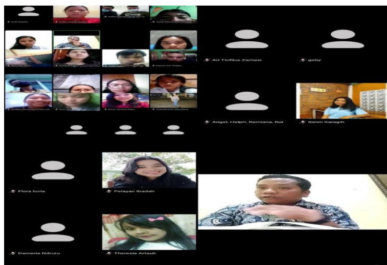
Gambar. 2 Pertemuan Pertama via Daring Platform Zoom Pemimpin Ibadah

gereja Pentakosta atau Pantekosta serta Bethel dan kharismatik 23 lainnya berbeda dengan denominasi gereja di luarnya.