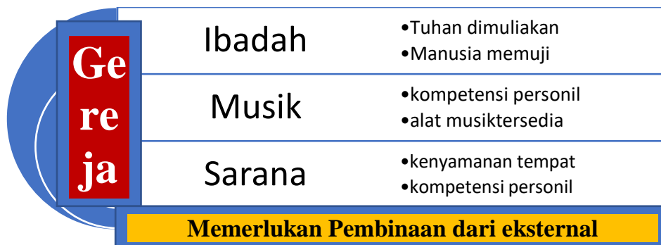
Tabel 2. Bagan Hubungan Gereja, Musik dan Ibadah

Untuk terselenggaranya acara dengan baik, maka ditentukan langkah-langkah sebagai berikut; pertama mengadakan observasi atas situasi lapangan, sehingga kegiatan pengabdian masyarakat menjadi tepat sasaran dan sesuai kebutuhan. Kedua menentukan lokasi dari empat gereja yang ada serta meminta izin dari Gembala. Ketiga, menentukan hari pelaksanaan bersamaan dengan itu menentukan fasilitator/pembicara untuk dua topik dimaksud agar kompetensi fasilitator menjadi jawaban atas kebutuhan lapangan. Di dalamnya turut membicarakan materi-materi atau sumber materi yang dipakai, misalnya buku Aris Wijayanto 12 yang telah dipakai banyak denominasi gereja selama bertahun-tahun. Tentu kecakapan dalam mengajar dan menyampaikan materi 13 menjadi pertimbangan agar tujuan giat dimaksud tercapai. Untuk bidang musik diminta kesediaan Berton BH Silaban dengan Tim Musik, sedangkan untuk bidang song leader dan teknik menyanyi diminta kesediaan Pdm. Januaster E Siringoringo, dosen dan guru vokal/ coaching vocal dari MD GPdI Sumatera Utara. Keempat, mengadakan evaluasi serta mempersiapkan laporan giat pengabdian masyarakat sebagai satu artikel untuk diajukan pada jurnal abdimas online .