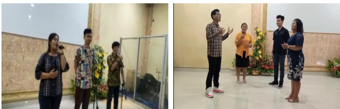
Gambar. 3 Pelatihan Tatap Muka Pemimpin Ibadah

Setelah pertemuan daring, dilangsungkan pula pertemuan on site untuk melihat kemampuan peserta pelatihan dalam bermain musik dan memimpin ibadah. Berlangsungnya pelatihan on site juga dijadwal secara acak dan berjumlah tetap agar menghindari kerumunan. Namun tetap menjaga keseriusan dalam praktik.