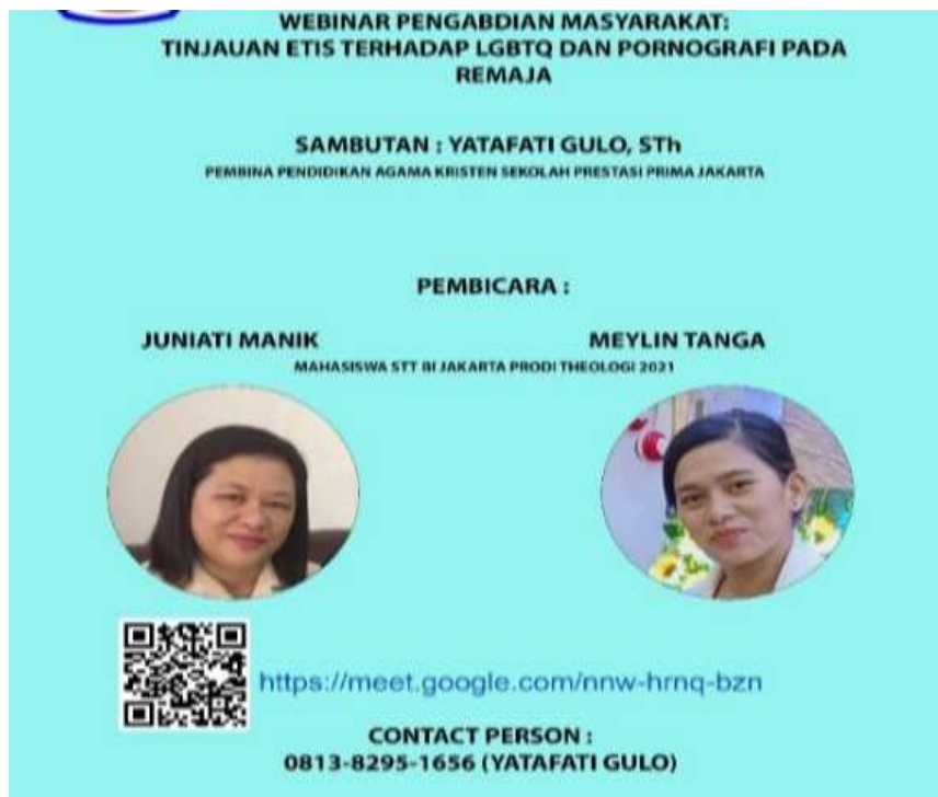
Gambar 2. Tema webinar

Pembicara webinar memberikan materi yang sudah disiapkan dan mendapat respons positif dari peserta. Dengan terbuka beberapa participant menyatakan pornografi telah menyeret beberapa teman lain kepada pergaulan bebas. Hal ini melebihi hipotesis awal bahwa remaja kecanduan dan terganggu secara kognitif dan butuh kajian lebih dalam lagi. Remaja secara jujur memaparkan bahwa selama ini mereka pernah kecanduan pornografi, tetapi mereka memutuskan untuk keluar dari kecanduan tersebut karena telah merasa rugi. Mereka menjadi kurang fokus, sulit untuk belajar dengan baik, dan kesehatan tubuh yang terganggu. Mereka jadi sulit istirahat dan selalu merasa letih ketika bangun pagi dan berkegiatan.