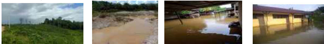
Gambar 1 Gambar 2 gambar 3 Gambar 4

Program pengabdian kepada masyarakat yang telah dirancang sedemikian rupa telah dilaksanakan sesuai dengan yang telah ditargetkan baik dari segi waktu maupun metode pelaksanaannya. Program ini dilakukan dari latar belakang melihat hutan di kalimantan sudah mulai rusak dan terjadinya banjir di beberapa wilayah. Berikut adalah gambar yang berhasil diambil;