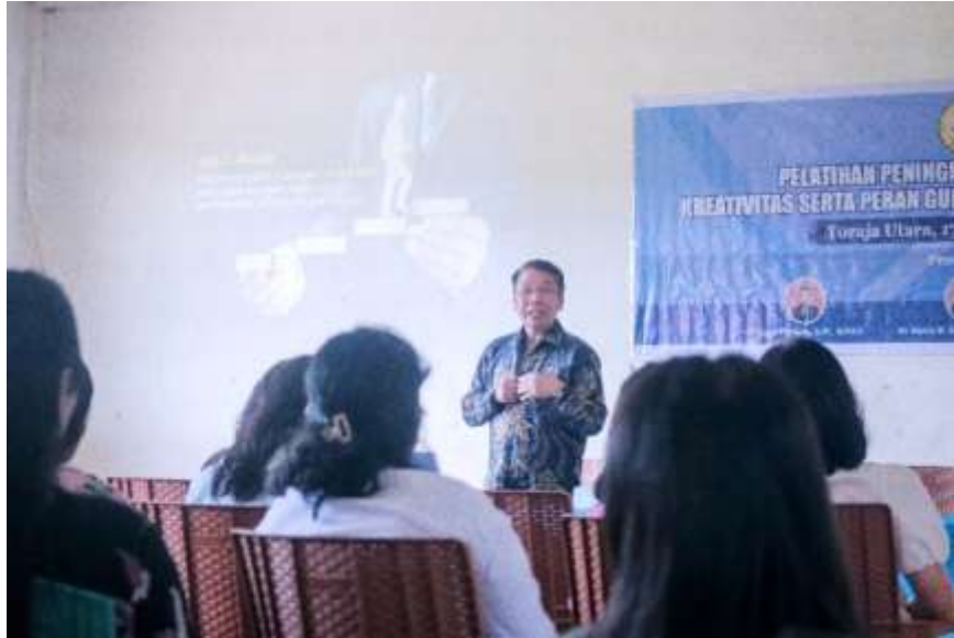
Gambar 1 menyampaikan ceramah

tujuan dari mentoring secara sederhana dan mudah dimengerti. Pelaksanaan seminar juga dilakukan dengan tanya jawab baik dari peserta ataupun sebaliknya.